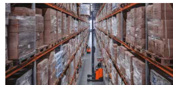
Design skladu - regálových systémů i flotily