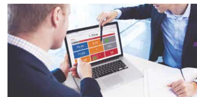
Správa flotily I_Site