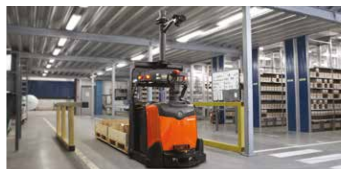
Automatizace s BT Autopilot