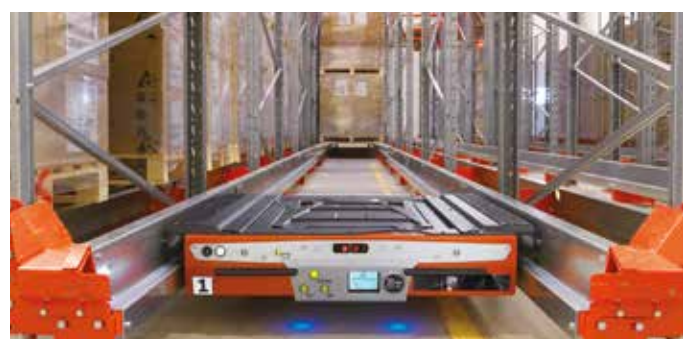
Vysokohustotní skladování s BT Radioshuttle